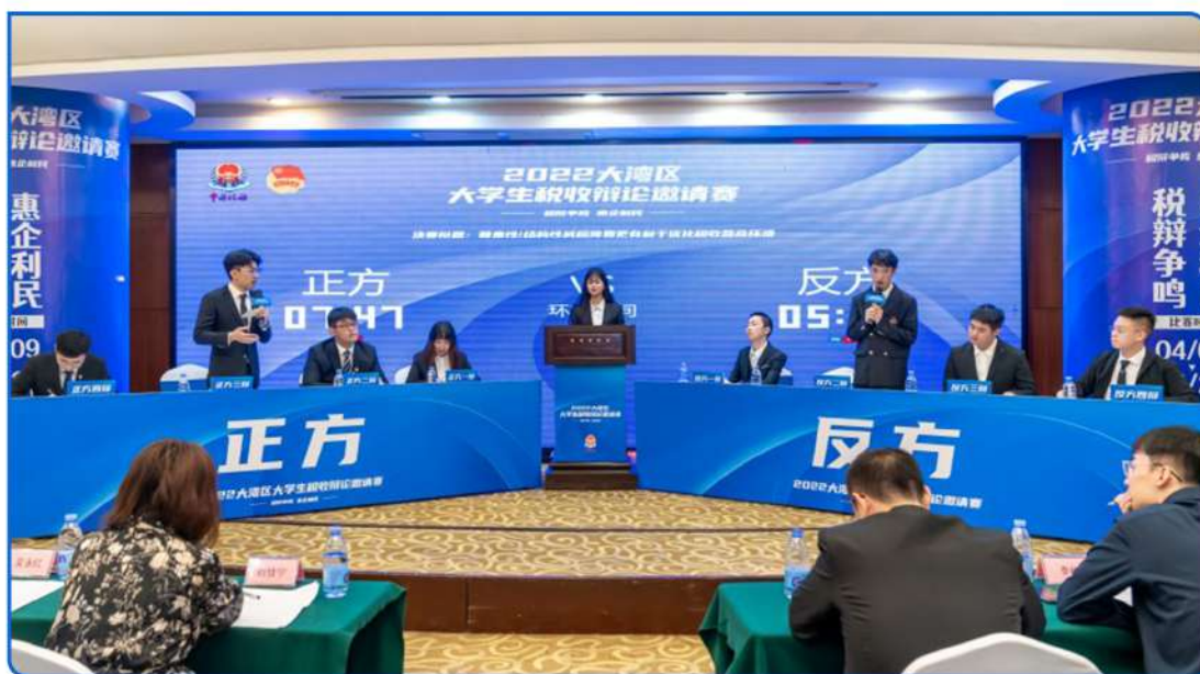
▲ 图：2022大湾区大学生税收辩论赛以“税辩争鸣，惠企利民”为主题，来自粤港澳三地24所高校的辩论队伍共同打造了一场税收主题的辩论盛宴，营造社会各界畅谈税事，共话税收的热烈氛围。