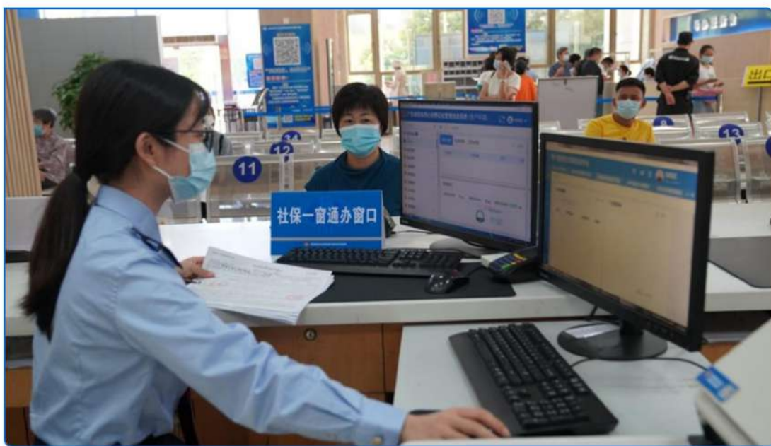
▲ 图：社保“一窗通办”窗口

主动进驻市社保中心，以“一厅联办”为载体，在全省率先推出“一人双系统、一窗全办结”的社保经办和缴费全链条业务办理新模式，缴费人只在一个窗口，提交一次资料即可完成税务、社保业务的综合办理，有效解决过去缴费人办理社保业务两边跑的难点、耗时长的痛点。