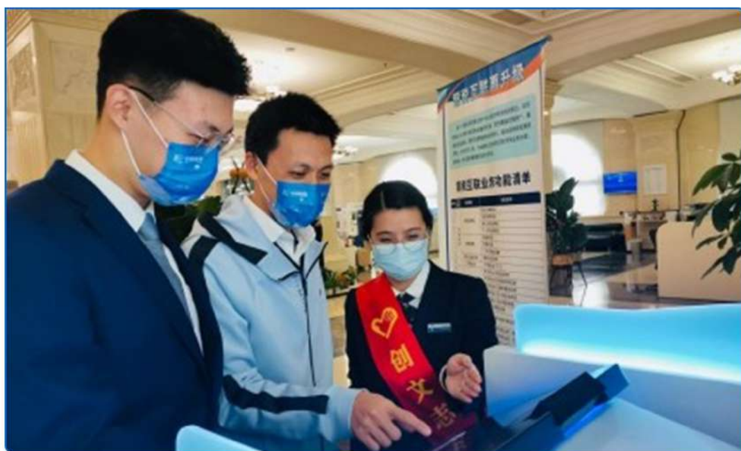
▲图：市民体验全新的“银税互联”自助办税服务