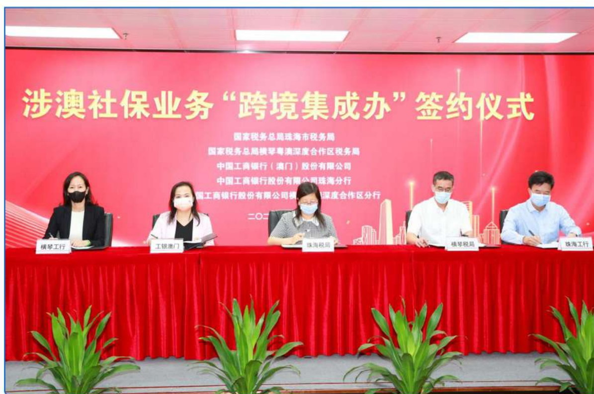
▲图：涉澳社保业务“跨境集成办”签约仪式

联合社保、银行等机构不断深化“放管服”改革，提升办理社保业务的便捷程度。符合条件的澳门居民和内地赴澳务工人员可在澳门就可办理参保缴费等社保业务，可在工银澳门18个网点“一站式”体验社保政策咨询、业务办理辅导等全流程服务。