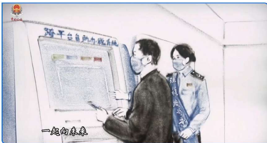
▲图：在中国共青团成立100周年，珠海市税务局通过沙画形式展示税务青年在深化党史学习教育、落实税费优惠政策、助力湾区建设等方面的精神面貌。