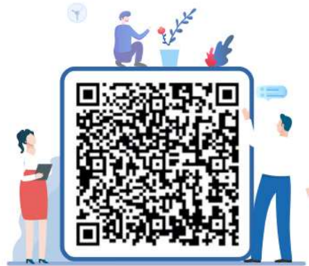
▲图：扫描二维码进入专栏