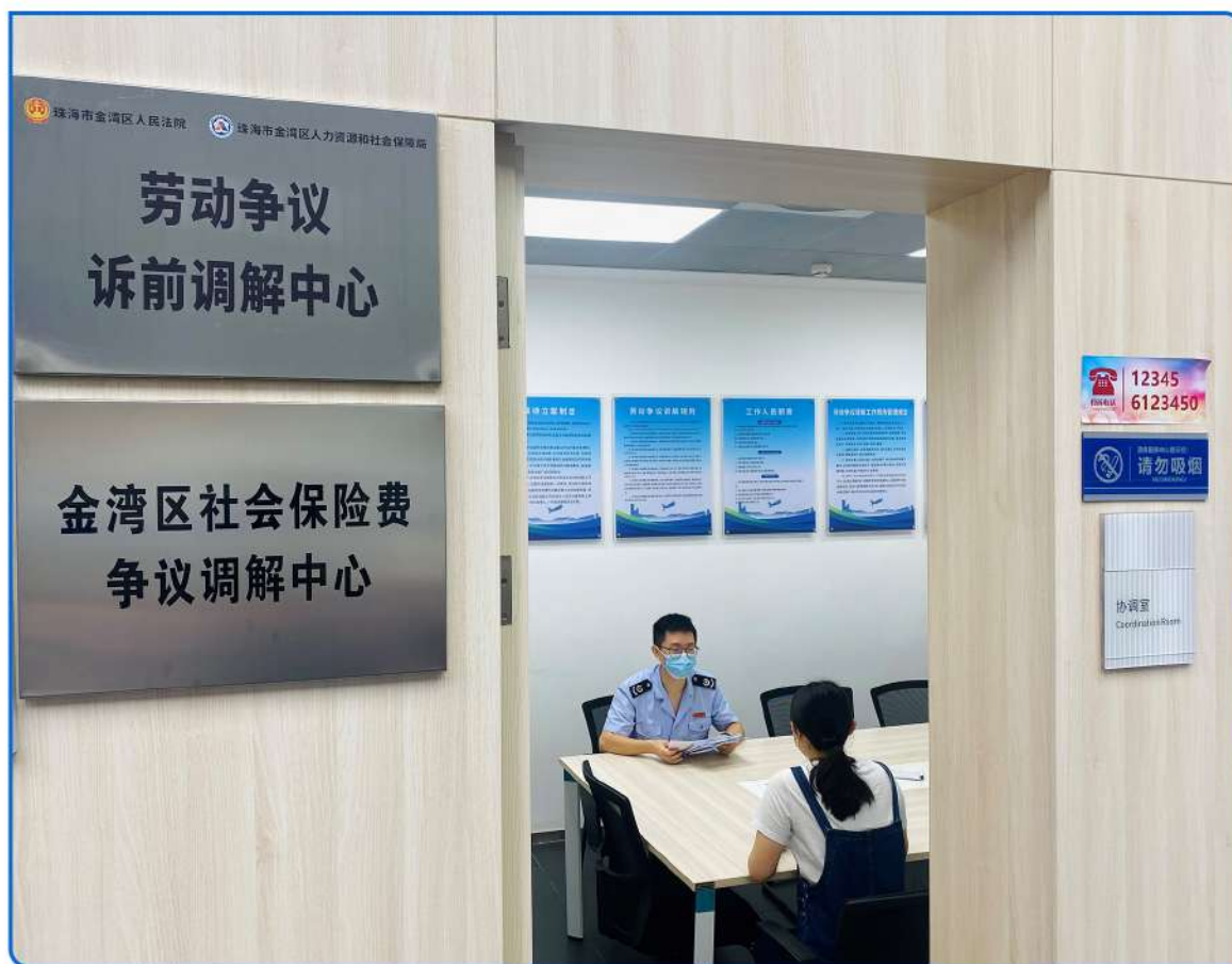
▲ 图：金湾区社会保险费争议调解中心