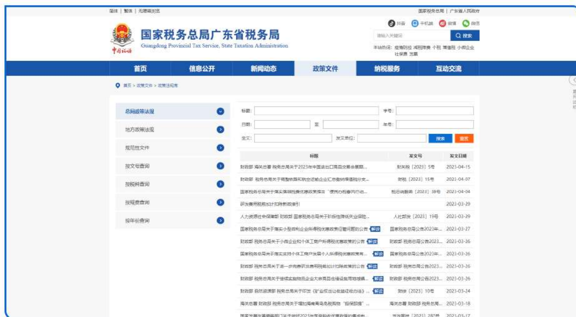
▲ 图：在珠海市税务局门户网站设立税收政策法规库。内设“总局政策法规”、广东省内各地市“地方政策法规”、“规范性文件”模块，纳税人缴费人可通过文号、税种、规费、年份等关键信息对相关税收法律法规信息进行搜索。