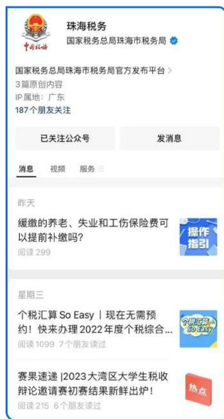
图：“珠海税务”微信公众号每日推送税收宣传政策，2022年共发布微信推文722条，关注量达29.3万人，为纳税人缴费人获取税收政策提供便利，获得纳税人缴费人好评。