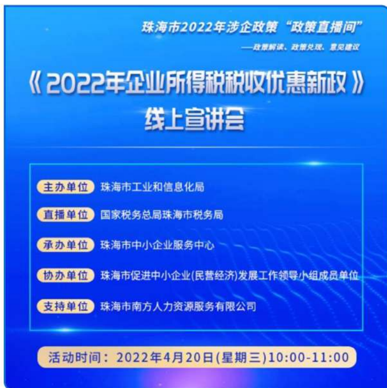
图：珠海市税务局做客珠海市工业和信息化局中小企业服务中心政策直播间，对政策进行直播宣讲，解决热点税费问题，单场直播观看量达2.2万人次。