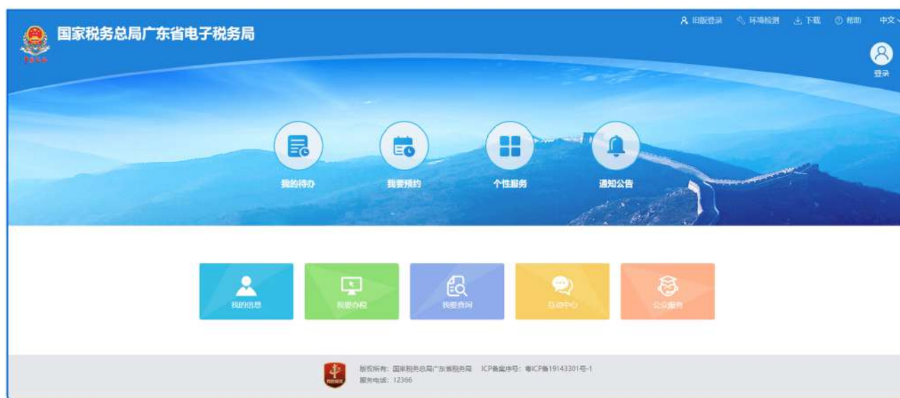
▲图：广东省电子税务局

积极融入“数字政府”建设，大力推进服务渠道“数字化”转型，推进212项税费事项“全程网上办”，线上业务的平均响应时间压缩至半小时内。