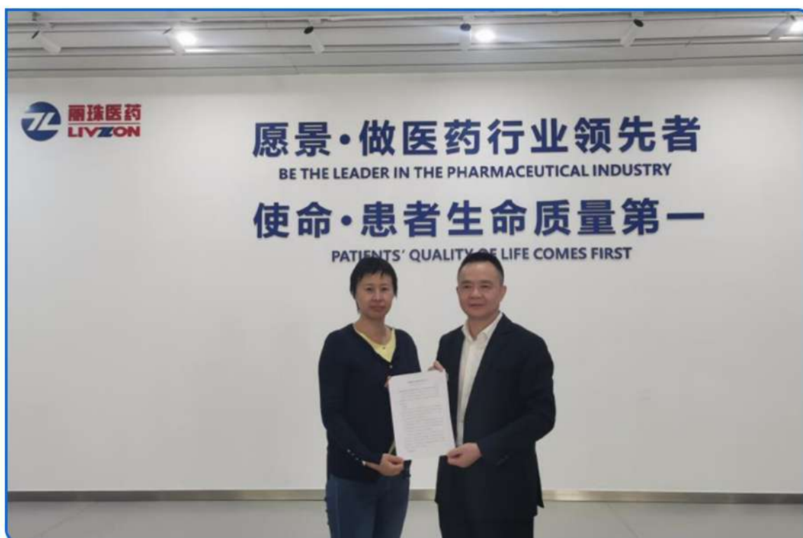
▲ 图：珠海市税务局为珠海市丽珠单抗生物有限技术公司出具《税收事先裁定意见书》，提供税收确定性服务。

进一步健全完善大企业复杂涉税事项事先裁定工作机制，优化完善相关工作程序，加大推广力度，为企业出具税收事先裁定意见书，积极维护大企业合法权益。