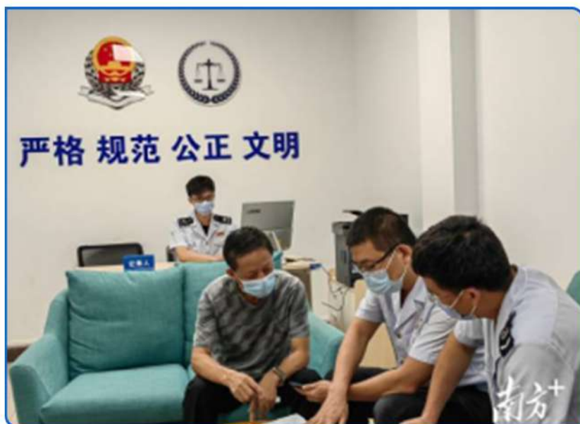
▲ 图：税务公职律师在涉税争议咨询调解中心为纳税人缴费人提供涉税业务咨询和法律援助服务。