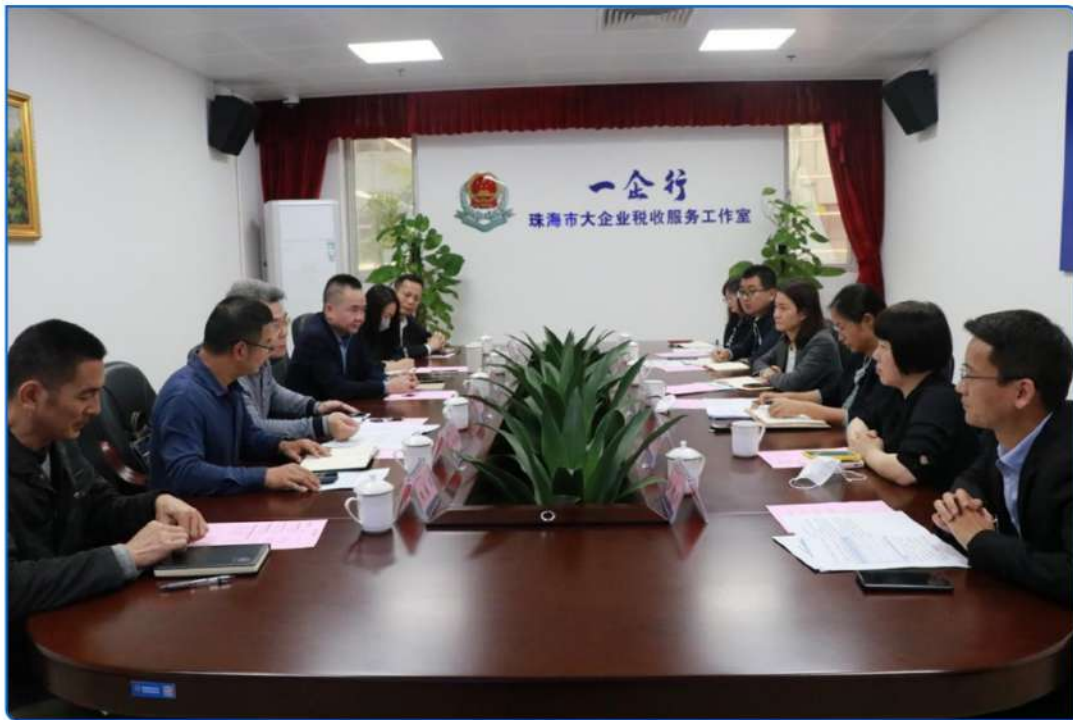
▲ 图：珠海市大企业税收服务工作室

联合市政府相关职能部门为大企业提供税收体检和风险提醒服务，最大限度为企业降低税务风险，提高重点建设项目经济质效，打造具有珠海特色的大企业税收服务品牌。