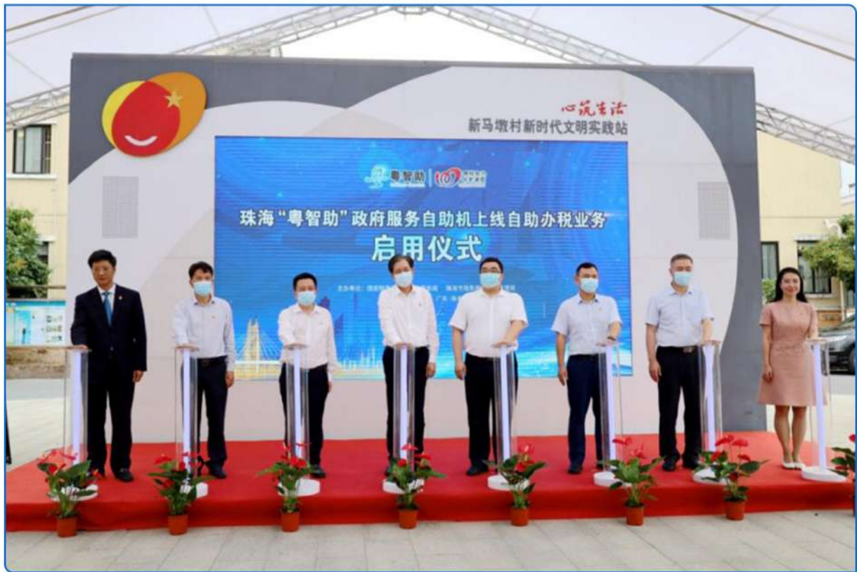
▲图：珠海“粤智助”线上自主办税业务启动仪式

在全省率先推动税费服务在“粤智助”政府服务自助终端上线，为村民提供“就近办、一站办、快捷办”的政务融合服务。不断拓展“粤智助”服务事项，率先将“粤智助”税费服务事项从34项拓展到57项。