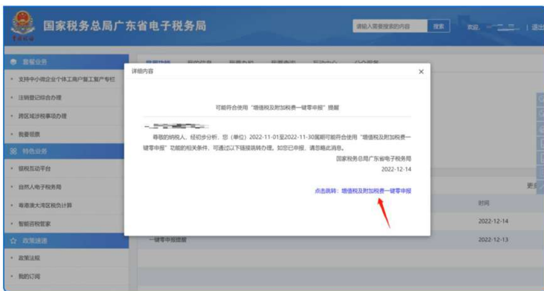
▲ 图：电子税务局一键预填