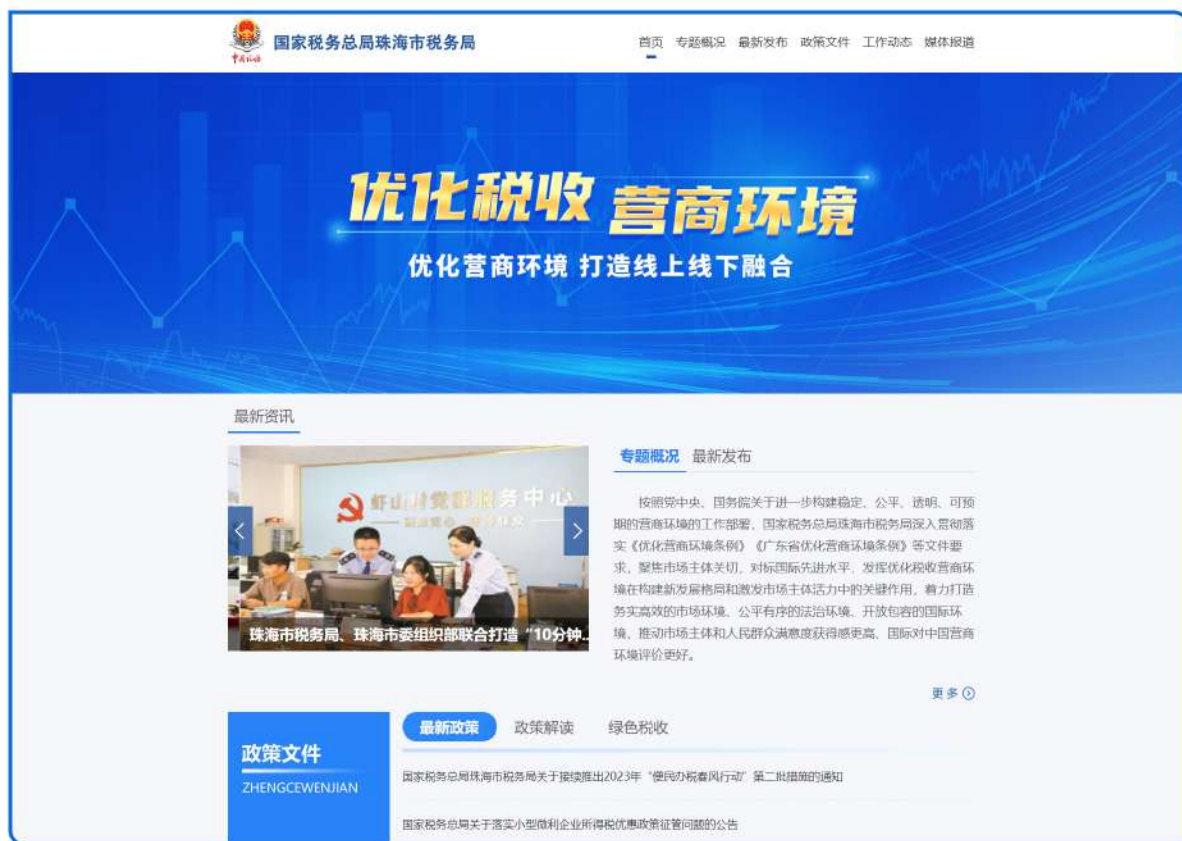
▲ 图：开设“优化税收营商环境”专栏。及时更新各项税费政策，并提供相应政策解读。方便纳税人缴费人理解、掌握最新税费政策，助力税收营商环境持续优化。

珠海市税务局畅通宣传渠道，及时更新税收法律法规信息，通过“珠海税务”官方微博、公众号、直播宣讲、游园会、培训辅导、税法宣传进校园等方式多渠道开展税收宣传，确保税收政策落地落实、税收优惠应享尽享。