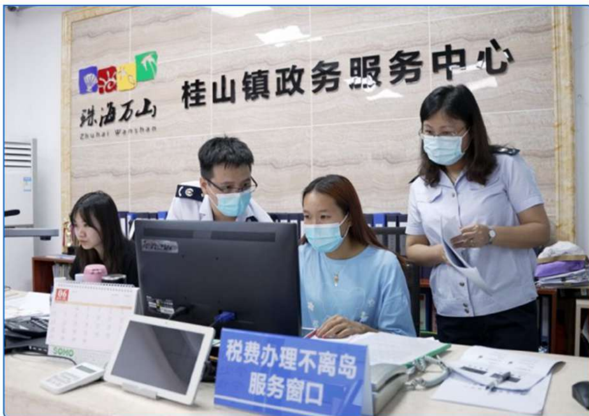
▲ 图：珠海税务部门先后在斗门区、平沙镇、担杆镇、万山镇依托党群服务中心推出税费办理“不出村”“不离岛”“进社区”服务，受到广大群众的欢迎和好评。