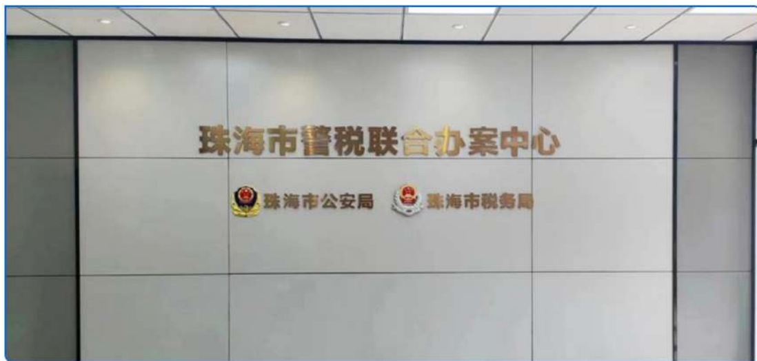
▲ 图：珠海市警税联合办案中心

成立警税联合办案中心，探索税务行政稽查与公安刑事侦察的衔接内容与形式，实现统一指挥、研判协商、办案、培训等多元化、实体化运作。