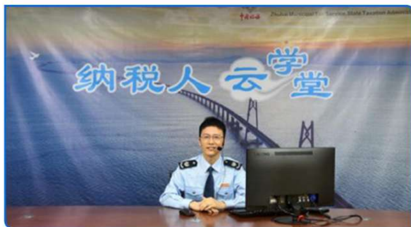
图：打造全新“纳税人云学堂”直播间。分行业、分专题做好面向小微市场主体的“线上”政策辅导，创新模式开展在线可视化答疑，拓宽税费政策宣传渠道。