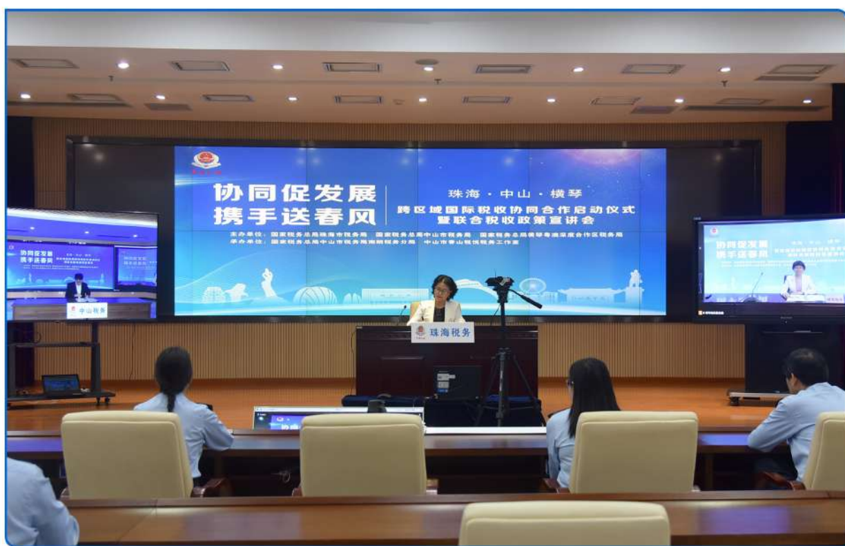
▲ 图：三地国际税收协同合作签约

珠海、中山、横琴粤澳深度合作区共同签署《跨区域国际税收协同服务工作备忘录》，从管理和服务上深度探索互信、互认、互联机制，实现执法统一、服务增效，助推开拓区域合作新局面。