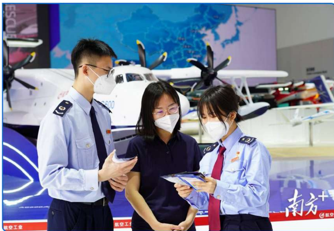
▲ 图：珠海市税务局党员税宣先锋队向航展参展企业和参观观众宣传税收优惠政策和服务创新