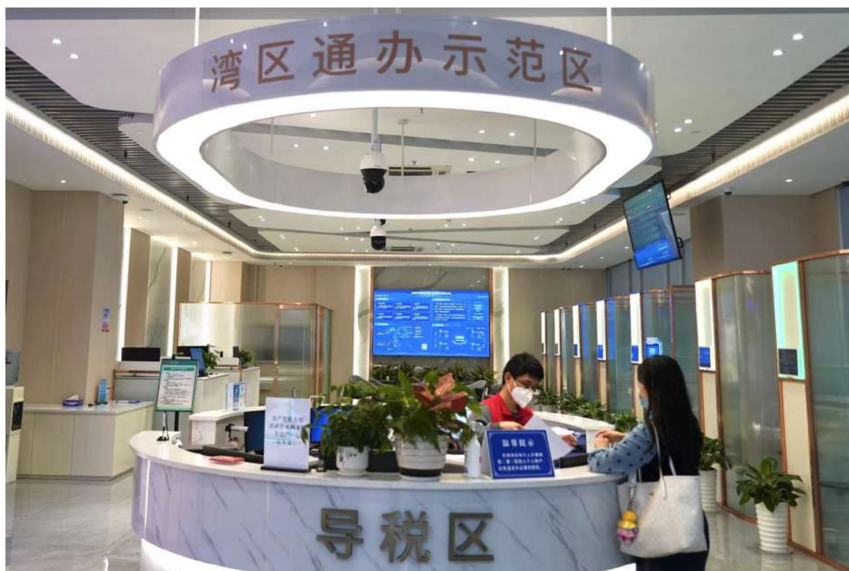
▲ 图：珠海市金湾区税费业务综合服务厅在该区市民中心正式启用，这是以智慧税务与数字政务深度融合为理念全新打造的智能化办税服务厅。

在2021年大幅撤窗并厅的基础上，进一步推动办税服务厅转型升级,打造金湾区局税费业务综合服务厅成为全省首个全面应用跨平台自主办税系统、以“设备+服务”模式整体进驻政务服务中心的“样板厅”。