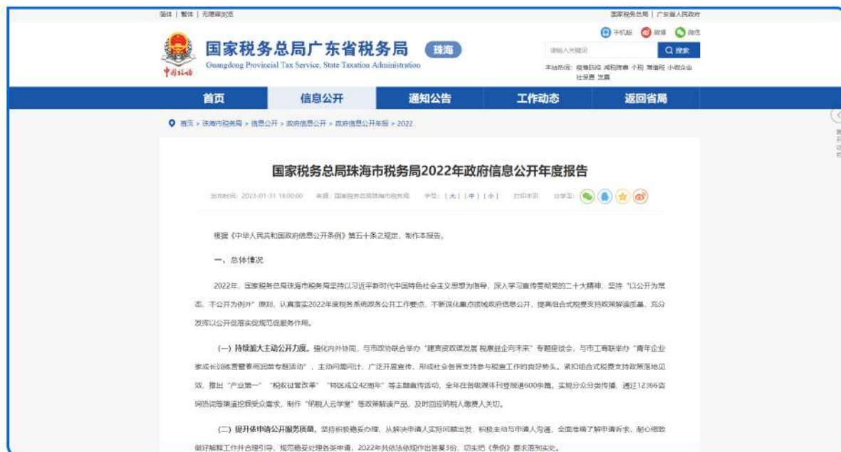
▲ 图：定期通过门户网站发布《政府信息公开年度报告》