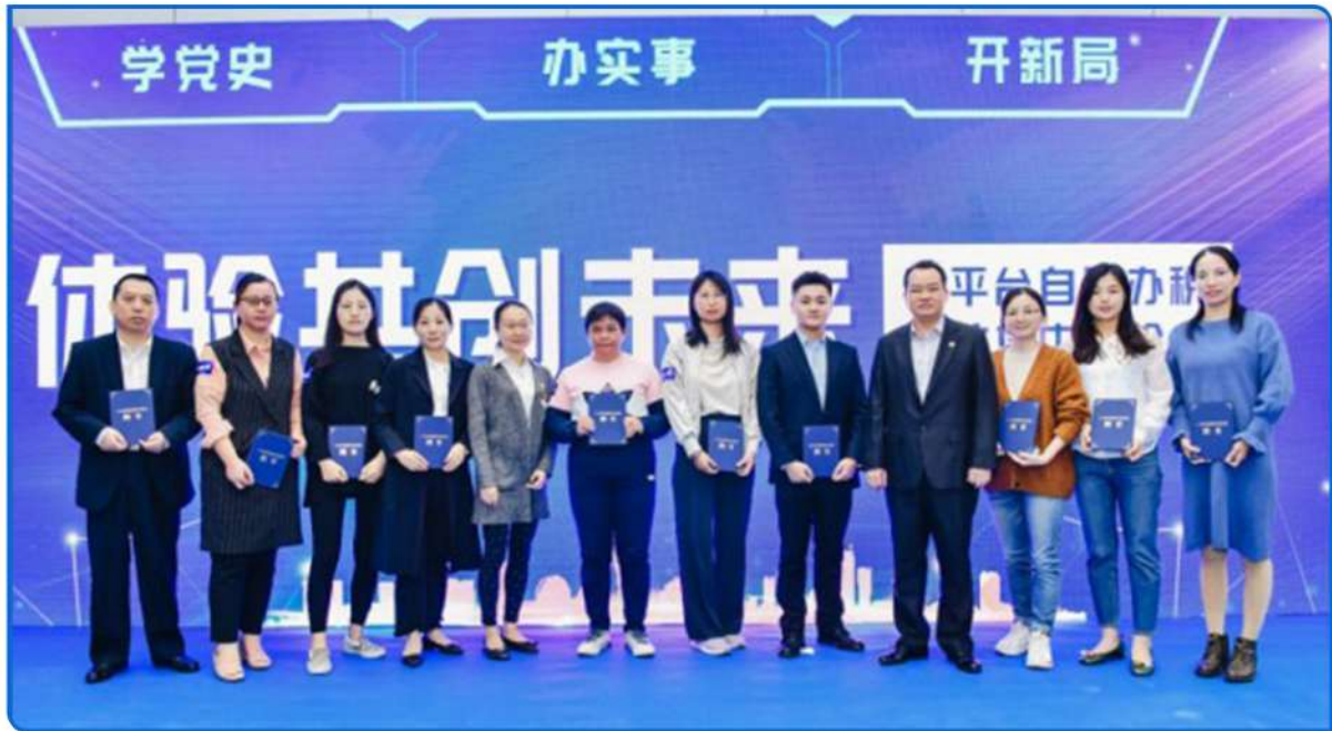
▲ 图：体验共创未来——跨平台自助办税系统集中体验活动。