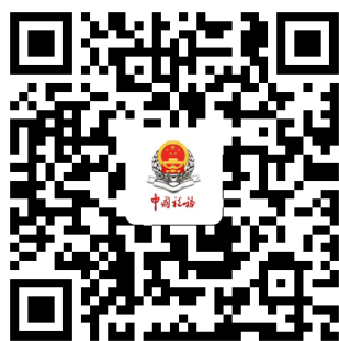
广州税务微信公众号