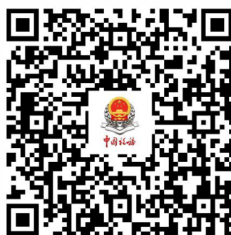
企业所得税政策专题专栏