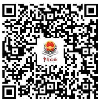
企业所得税汇算清缴专栏