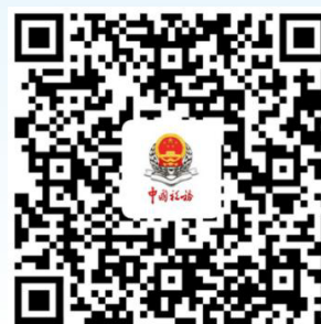
3. 查账征收年度申报表调整内容