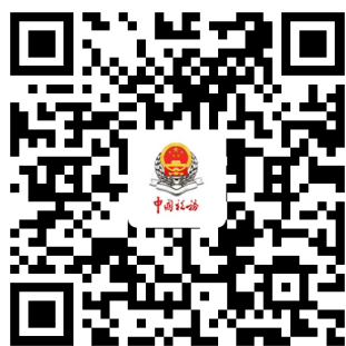
广东税务微信公众号