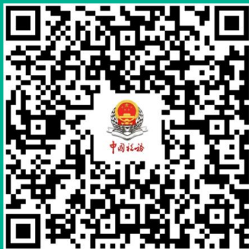
企业所得税 汇算清缴专栏