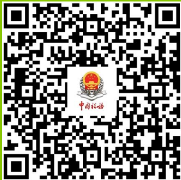
企业所得税 政策专题专栏