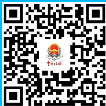
广州税务 微信订阅号