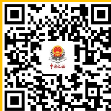
广州税务 微信服务号