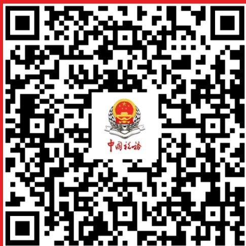
企业所得税 政策专题专栏