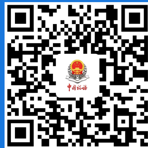
广州税务 微信服务号