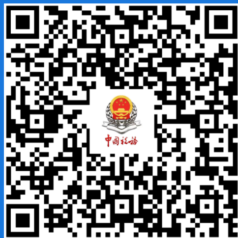
企业所得税 汇算清缴专栏