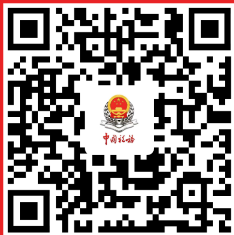
广州税务 微信订阅号