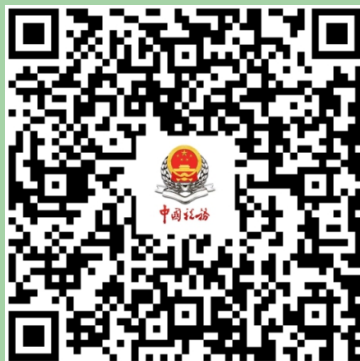
企业所得税 汇算清缴专栏