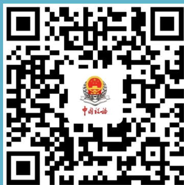
广州税务 微信订阅号