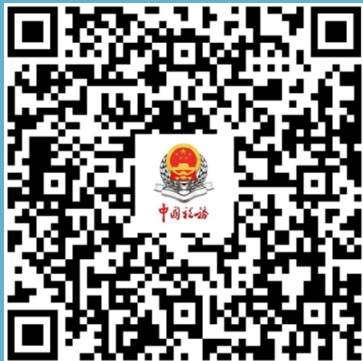
企业所得税 政策专题专栏