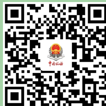
广州税务 微信服务号